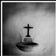
1º PREMIO JAVIER LINARES SERRANO